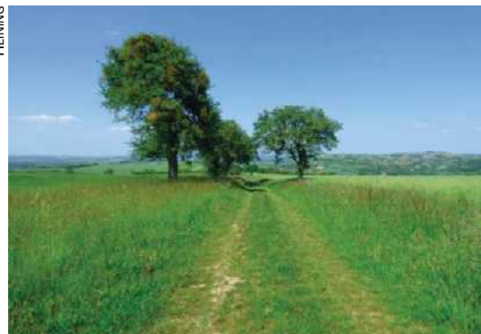
Une ancienne allée fruitière préservée à Heining-lès-Bouzonville (Moselle), primée au concours « Allées d'arbres ».