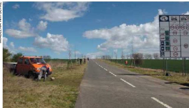
Allée transfrontalière créée entre la Pologne et l'Allemagne.