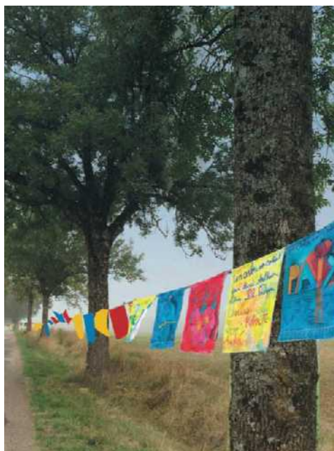
Le projet « un soldat, un arbre » propose de créer des installations artistiques sous la forme d'un ruban de drapeaux de mémoire réalisés avec des enfants en France et au Niger.

Durant la Grande Guerre, les soldats étrangers venus combattre sur notre territoire ont été fortement marqués par la présence des arbres bordant les routes : ils sont près de trois millions à cette époque en France. « Les troupes se sont senties dynamisées par ces arbres rythmant les routes. Une vision positive ternie lorsque les alignements sont apparus de plus en plus lacunaires à l'approche du front, annonçant l'imminence des combats destructeurs. Les allées d'arbres ont été un motif très présent dans les lettres et les dessins qu'ils ont envoyés à leurs familles ou, plus tard, dans les récits qu'ils ont faits », explique Chantal Pradines, déléguée générale du colloque et de l'association « Allées-Avenues,