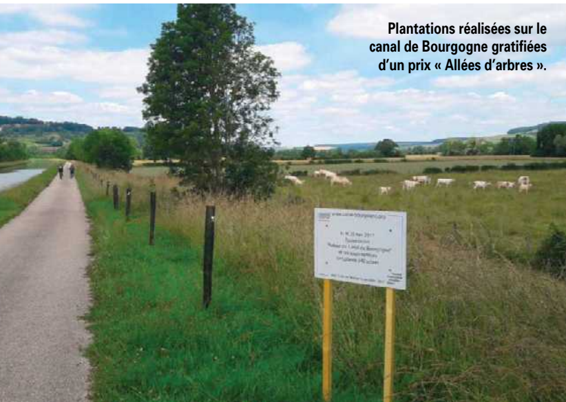
Plantations réalisées sur le canal de Bourgogne gratifiées d'un prix « Allées d'arbres ».