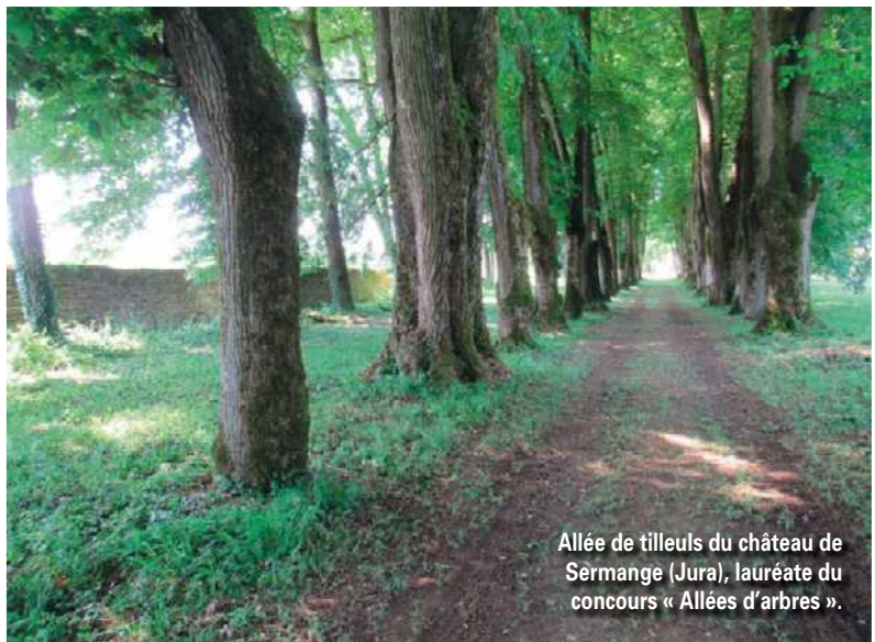
Allée de tilleuls du château de Sermange (Jura), lauréate du concours « Allées d'arbres ».